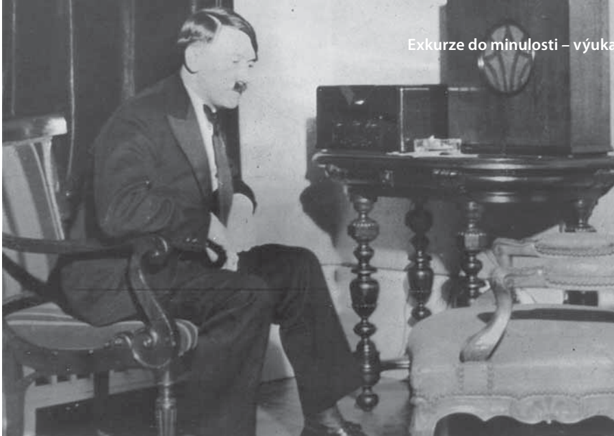
Adolf Hitler poslouchá počátkem roku 1933 výsledky parlamentních voleb z rozhlasu. Brzy byla legální pouze nacistická strana. Všechny ostatní politické strany byly zakázány.